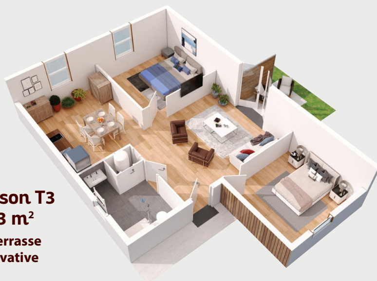
Maison T3 63 m 2 + terrasse privative

Maisons PMR : adaptées aux Personnes à Mobilité Réduite