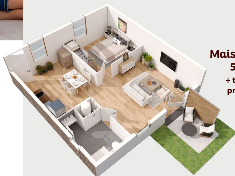
Maison T2 XL 53 m 2 + terrasse privative